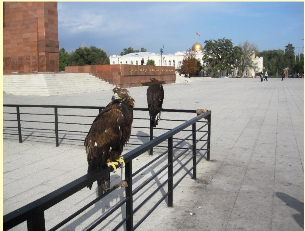
Беркуты в на главной площади Бишкека