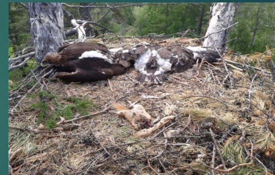
27 июня 2013 г.