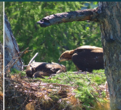
1 июля 2015 г.